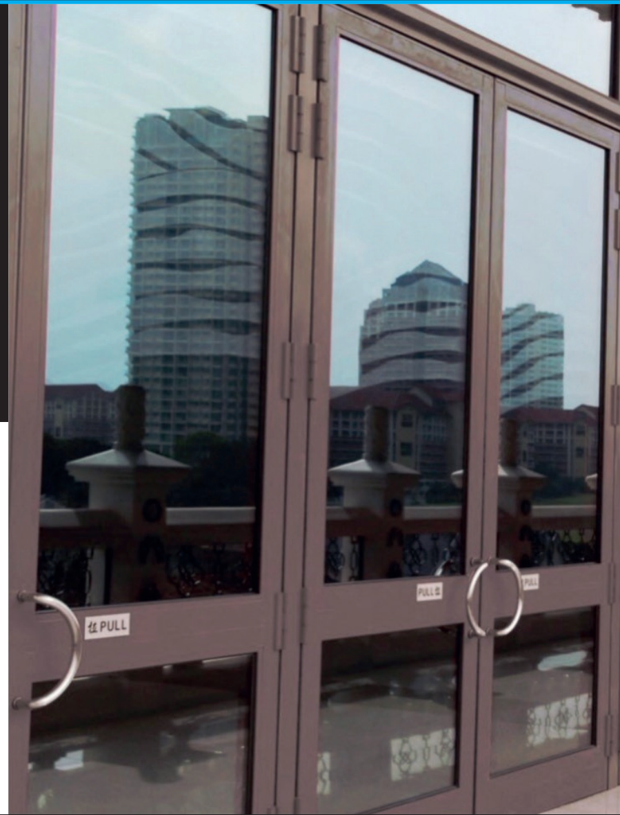
PUERTA A54P Edificio de vivienda Hospitalet de Llobregat