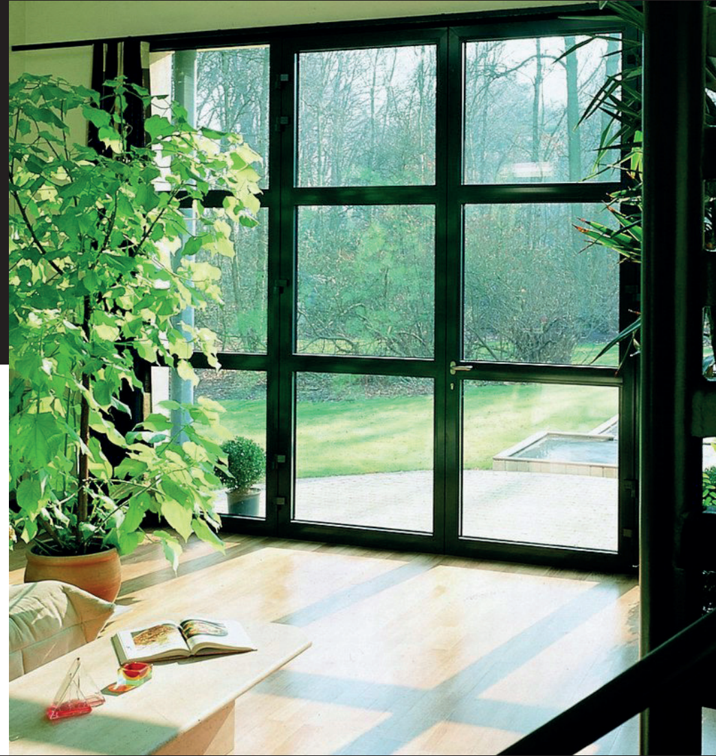
ALBA 75 RPT Reforma Integral Barcelona